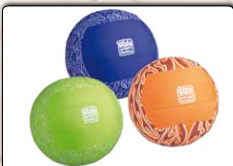
73664 Jumbo-Volleyball Neopren-Schaumstoffhülle, ca. 40 cm Durch- messer, sortiert in den Farben orange, grün und blau