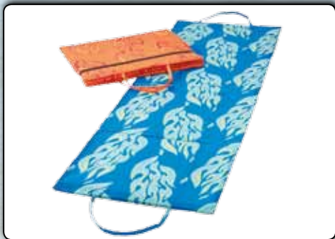
77926 Strandmatte ca. 190 x 60 cm, 2-fach sortiert orange und blau, 4-fach gefaltet VE 8