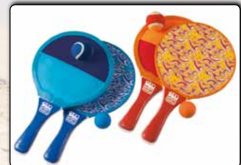
74050 Beach-Klettballspiel 2 in 1 Set, ca. 34 x 20 cm, je 1 Ball VE 48