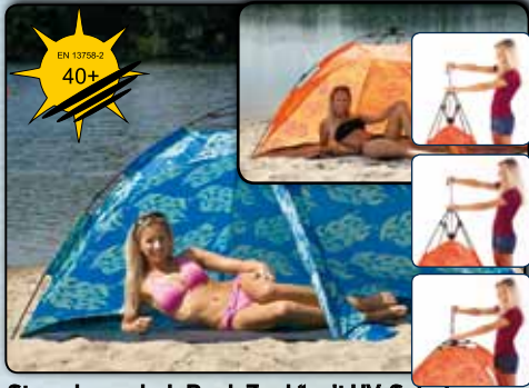
Strandmuschel „Ruck Zuck“ mit UV-Schutz ca. 215 x 150 x 115 cm, Polyester 190T super leichter Auf-und Abbau 77900 blaues Design 77901 oranges Design