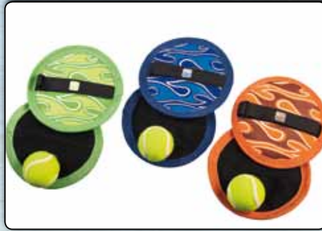
74087 Klettball-Fangspiel Neopren, ca. 19 cm Durchmesser, 1 Ball, ca. 6 cm, sortiert in den Farben orange, grün und blau