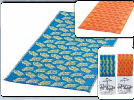
Strandmatte ca. 180 x 90 cm, PP Material, einzeln gerollt 77912 blaues Design VE 24 77913 oranges Design VE 24