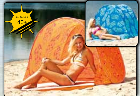
Pop-Up-Strandmuschel mit UV-Schutz ca. 150 x 100 + 50 x 100/90 cm, Polyester 190T 77920 blaues Design 77921 oranges Design