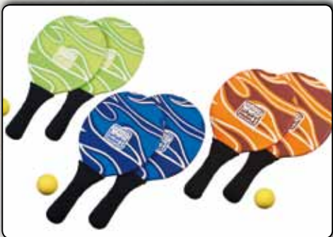
74013 Beachball-Set Neopren, 2 Schläger, 18 x 33 cm, 1 Ball, sortiert in den Farben orange, grün und blau VE 20