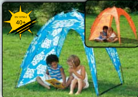
Kinder Pavillon mit UV Schutz, ca. 130 x 130 x 130 cm, Schutz für z.B. Pools oder Sandkisten, Polyester 190T 77908 blaues Design 77909 oranges Design