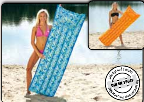
Luftmatratze ca. 180 x 69 cm, PVC Folie ca. 0,18 mm 77914 blaues Design 77915 oranges Design