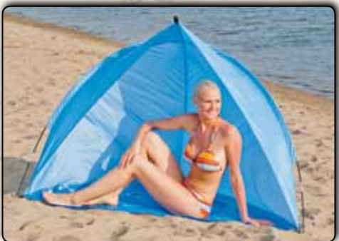
78096 Strandmuschel „Malle“ ca. 200 x 110 x 110 cm