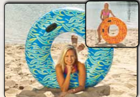
Wasserring ca. 120 cm, 2 Handgriffe, PVC Folie ca. 0,22 mm 77918 blaues Design 77919 oranges Design