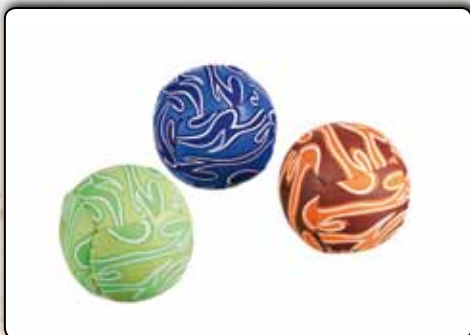
73660 2 x EVA-Bälle mit Neoprenhülle ca. 9 cm Durchmesser, hochwertige Doppel- Blisterverpackung, sortiert in den Farben orange, grün und blau