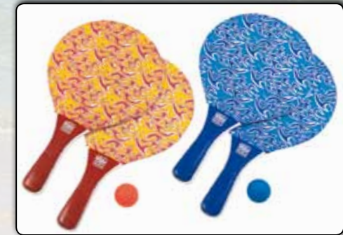
74019 Kinder-Beachball-Set ca. 34 x 20 cm, bunt 2-fach sortiert, Holz VE 24 74020 Beachball-Set 2 Schläger, 1 Ball, ca. 38 x 24 x 0,8 cm, bunt bedruckt, 2-fach sortiert VE 24