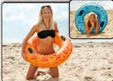
Wasserring, ca. 90 cm, 2 Handgriffe, PVC Folie ca. 0,20 mm 77916 blaues Design 77917 oranges Design