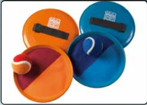
74083 Klettball-Fangspiel ca. 19 cm Durchmesser, 1 Ball, 2-fach sortiert