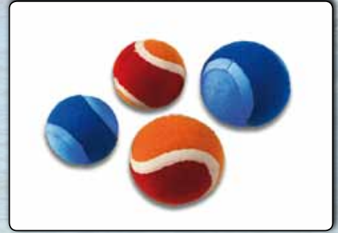
74090 Klettball-Ersatzbälle, 2 Stück à 50 mm, für Artikel 74050