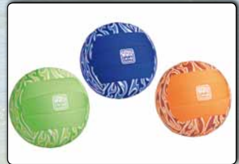
Neopren, wasserfest, griffig, bunt, sortiert in den Farben orange, grün und blau