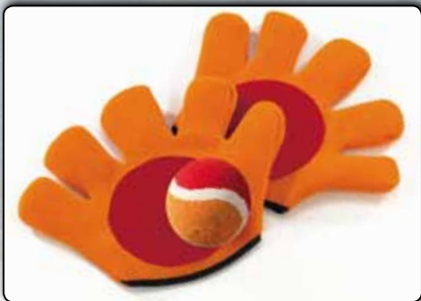
74092 Klettball-Fanghandschuhe 2 Stück, Klettball ca. 6 cm