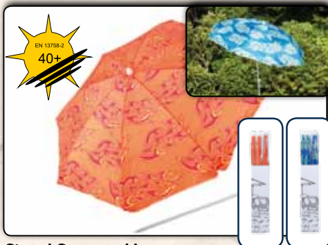
Strand-Sonnenschirm ca. 180 cm, mit UV-Schutz 77910 blaues Design 77911 oranges Design