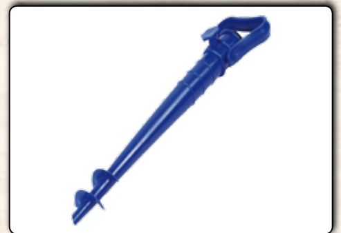
77929 Sonnenschirm-Dorn ca. 39 cm, für Schirmstangen bis 25 mm 12 Stück im Display