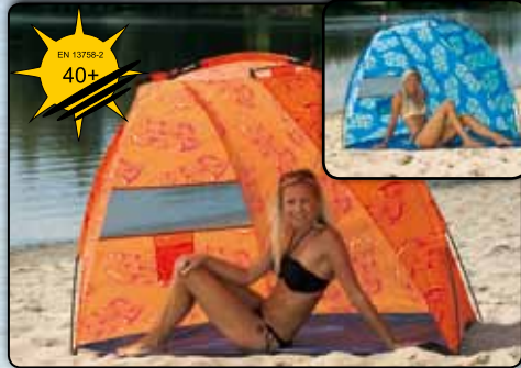
Strandmuschel „Helgoland“ mit UV-Schutz ca. 200 x 120 x 120 cm, Polyester 190T mit 2 Fenstern und Innentaschen 77902 blaues Design 77903 oranges Design