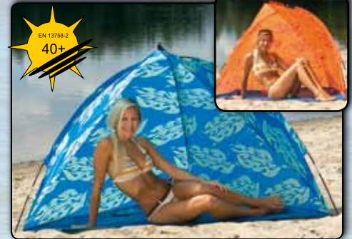
Strandmuschel „Amrum“ mit UV-Schutz ca. 200 x 120 x 110 cm, Polyester 190T, „Mini-Packmaß“ ca. 30 x 8,5cm 77904 blaues Design 77905 oranges Design