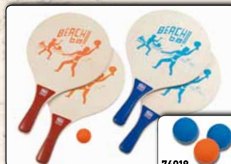
74021 Beachball-Set 2 Schläger, 1 Ball, ca. 38 x 24 x 0,8 cm, Holz, naturfarben, bedruckt VE 12/24 74018 Beachbälle fluoreszierend, ca. 4 cm Durchmesser, 3 Stück VE 24/240