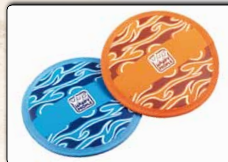
74028 Wurfscheibe ca. 23 cm, Neopren, sortiert in den Farben orange und blau VE 15/60