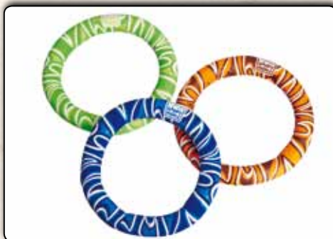
77216 Neoprentauchring 3 Stück, ca. 18 cm Durchmesser, ca. 230 g/St., sortiert in den Farben orange, grün und blau