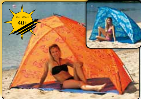
Strandmuschel „Fehmann“ mit UV-Schutz ca. 270 x 120 x 123 cm, Polyester 190 T 77906 blaues Design 77907 oranges Design