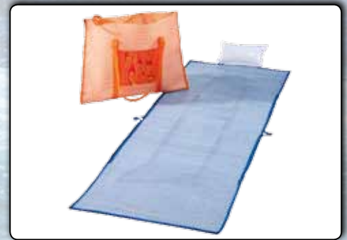
77925 2 in 1 Strandmatte ca. 170 x 58 cm, umfunktionierbar zur Tragetasche VE 10