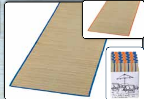
78205 Strandmatte ca. 180 x 60 cm, eingefasst, weiches Bast-Material, einzeln gerollt VE 50 78206 Strandmatte ca. 180 x 90 cm, eingefasst, weiches Bast-Material, einzeln gerollt VE 50