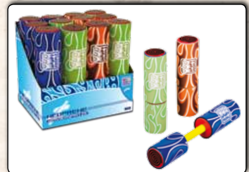
17108 Wasserkanone aus Schaumstoff, mit Neoprenbezug, ca. 15 cm, ca. 4 cm Durch- messer, ca. 7 m Reichweite, 12 Stück im Dis- play; sortiert in den Farben orange, grün und blau