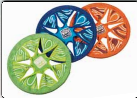
74015 Wurfscheibe Neopren, Speichendesign, ca. 21 cm, sortiert in den Farben orange, grün und blau VE 15/60