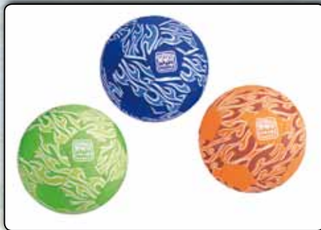
Neopren, wasserfest, griffig, bunt, sortiert in den Farben orange, grün und blau