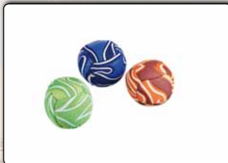
73661 3 x Minibälle Neopren mit beanbag-Füllung, 40 g, sortiert in den Farben orange, grün und blau