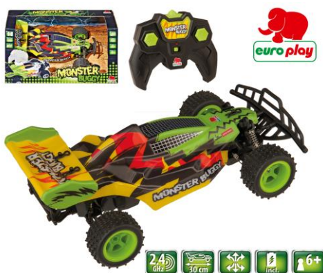
A cikk ábrája

Meghatalmazott Happy People GmbH & Co. KG Konsul-Smidt-Str 8b 28217 Bremen GERMANY