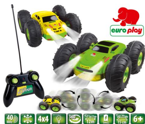
A cikk ábrája

Meghatalmazott Happy People GmbH & Co. KG Konsul-Smidt-Str 8b 28217 Bremen GERMANY