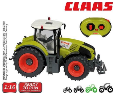
Abbildung des Artikels

Bevollmächtigter Happy People GmbH & Co. KG Konsul-Smidt-Str 8b 28217 Bremen GERMANY