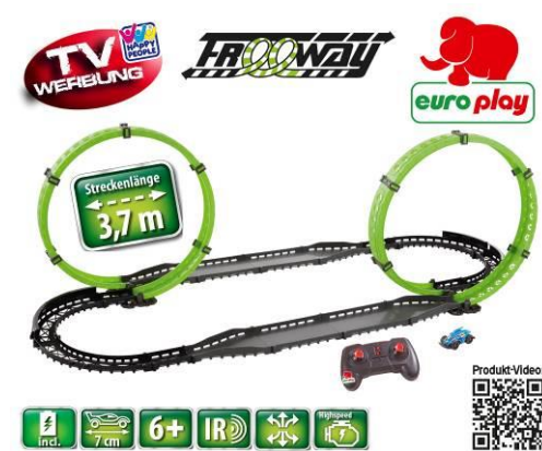
A cikk ábrája

Meghatalmazott Happy People GmbH & Co. KG Konsul-Smidt-Str 8b 28217 Bremen GERMANY