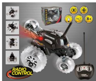
Abbildung des Artikels

Bevollmächtigter Happy People GmbH & Co. KG Konsul-Smidt-Str 8b 28217 Bremen GERMANY