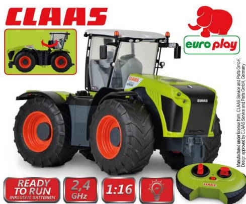
Afbeelding van het artikel

Gevolgmachtigde Happy People GmbH & Co. KG Konsul-Smidt-Str 8b 28217 Bremen DUITSLAND