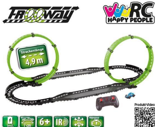
Imagen del artículo

Denominación de modelo y, si procede, número de artículo