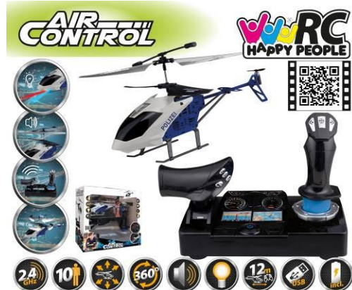
Afbeelding van het artikel

Gevolgmachtigde Happy People GmbH & Co. KG Konsul-Smidt-Str 8b 28217 Bremen DUITSLAND