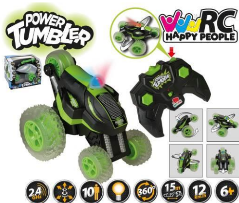
Ilustracja przedstawiająca produkt

Pełnomocnik Happy People GmbH & Co. KG Konsul-Smidt-Str 8b 28217 Bremen GERMANY