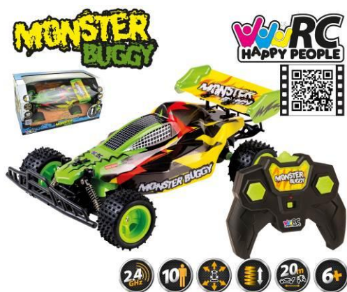
Ilustracja przedstawiająca produkt

Pełnomocnik Happy People GmbH & Co. KG Konsul-Smidt-Str 8b 28217 Bremen GERMANY