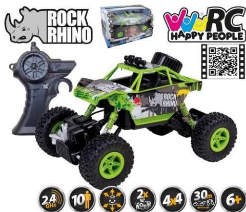
Afbeelding van het artikel

Gevolgmachtigde Happy People GmbH & Co. KG Konsul-Smidt-Str 8b 28217 Bremen DUITSLAND