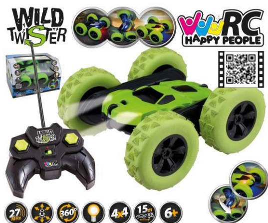
Ilustracja przedstawiająca produkt

Pełnomocnik Happy People GmbH & Co. KG Speicher I, Konsul-Smidt-Str. 8b 28217 Bremen GERMANY