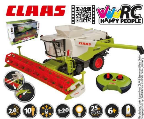
Ilustracja przedstawiająca produkt

Pełnomocnik Happy People GmbH & Co. KG Konsul-Smidt-Str 8b 28217 Bremen GERMANY