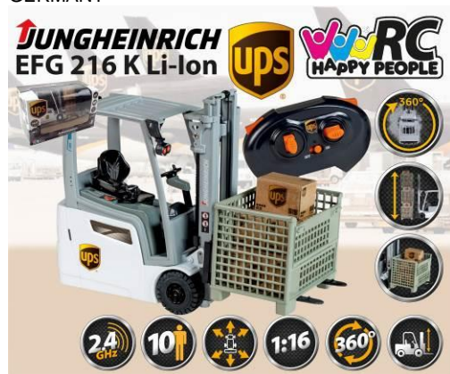
Abbildung des Artikels

Bevollmächtigter Happy People GmbH & Co. KG Konsul-Smidt-Str 8b 28217 Bremen GERMANY