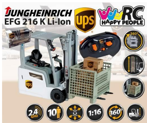
Ilustracja przedstawiająca produkt

Pełnomocnik Happy People GmbH & Co. KG Konsul-Smidt-Str 8b 28217 Bremen GERMANY