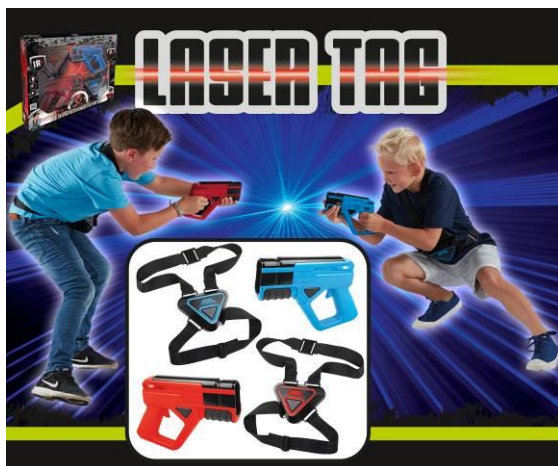
Ilustracja przedstawiająca produkt

Oznaczenie typu oraz jeśli to konieczne numer artykułu