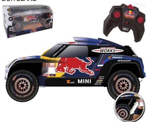
Afbeelding van het artikel

Gevolgmachtigde Happy People GmbH & Co. KG Konsul-Smidt-Str 8b 28217 Bremen DUITSLAND